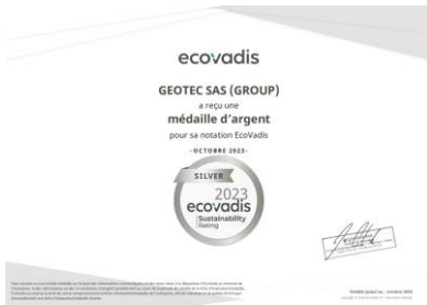
Score EcoVadis 2023

Géotec a construit sa politique RSE autour de 4 axes stratégiques en poursuivant ses actions destinées à prendre en compte et réduire les impacts de ses activités .