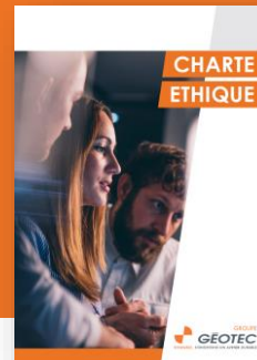
Charte éthique élaborée en 2019